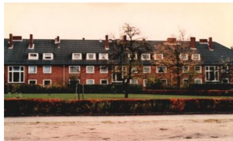
(Bsp. eines Hauses der Wohnanlage)