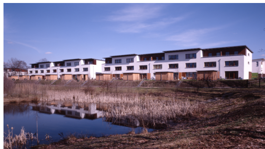
(Bsp. eines Teils der Wohnanlage)