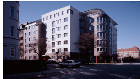
(Bsp. eines Hauses der Wohnanlage)