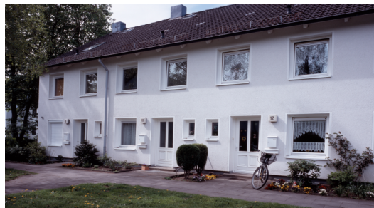
(Bsp. eines Hauses der Wohnanlage)