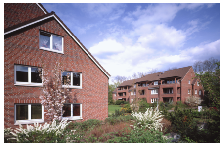
(Bsp. eines Hauses der Wohnanlage)