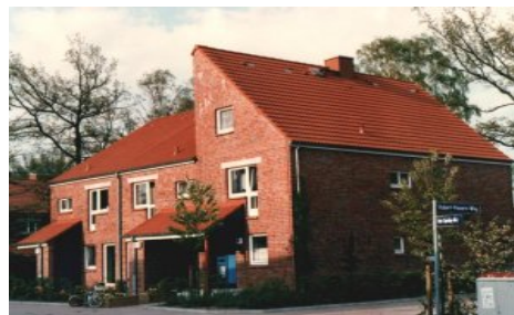
(Bsp. eines Hauses der Wohnanlage)