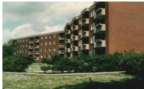
(Bsp. eines Hauses der Wohnanlage)