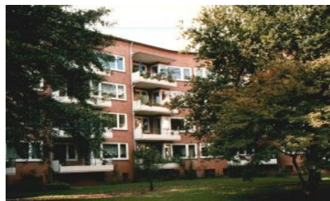
(Bsp. eines Hauses der Wohnanlage)