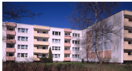
(Bsp. eines Hauses der Wohnanlage)