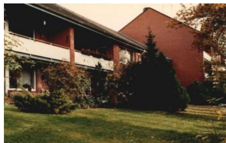
(Bsp. eines Hauses der Wohnanlage)