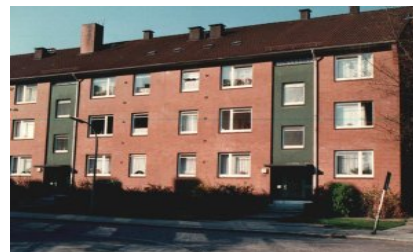
(Bsp. eines Hauses der Wohnanlage)