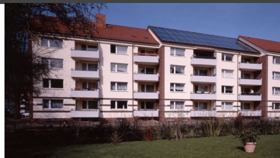
(Bsp. eines Hauses der Wohnanlage)