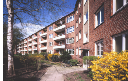
(Bsp. eines Hauses der Wohnanlage)