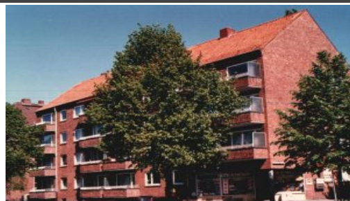
(Bsp. eines Hauses der Wohnanlage)