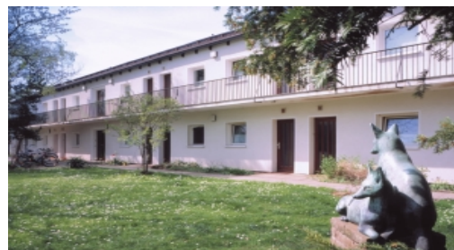
(Bsp. eines Hauses der Wohnanlage)