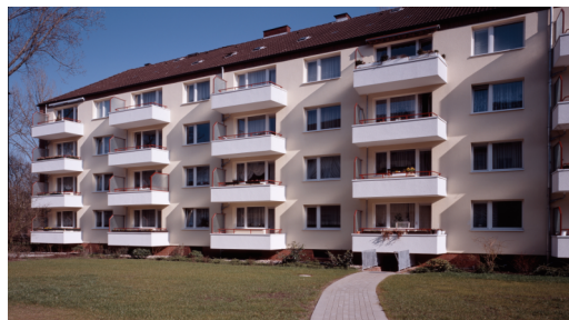
(Bsp. eines Hauses der Wohnanlage)