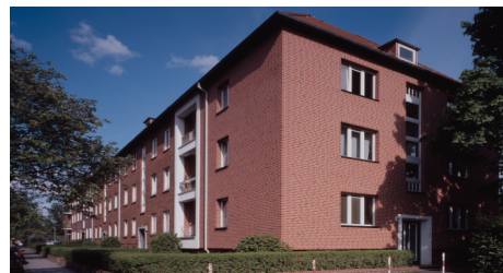
(Bsp. eines Hauses der Wohnanlage)