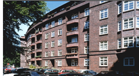
(Bsp. eines Hauses der Wohnanlage)