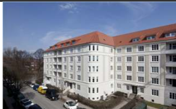
(Bsp. eines Hauses der Wohnanlage)