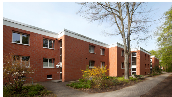
(Bsp. eines Hauses der Wohnanlage)