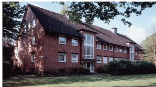
(Bsp. eines Hauses der Wohnanlage)