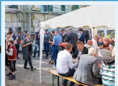
Mitglieder und Gäste beim Richtschmaus Im Ring