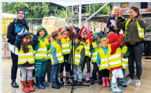
Kinderchor der CVJM-Kita Koppel