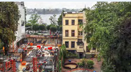
Noch ist der Blick zur Alster nicht verbaut.