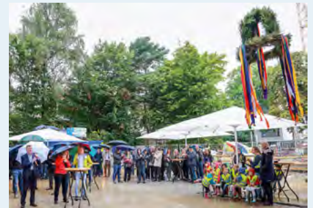
Richtkranz im Regen

Der Kinderchor der benachbarten CVJM-Kita Koppel brachte dann doch noch ein wenig „Sonnenschein“ in unsere Veranstaltung. Die Kinder ließen uns mit ihren Liedern den Regen vergessen!