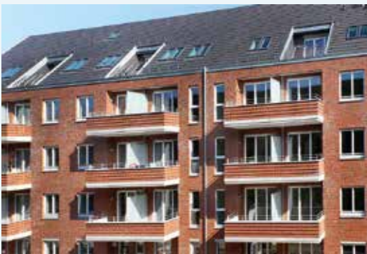
Ritterstraße 11 Eilbek 2 Wohnungen Dachgeschossaufstockung