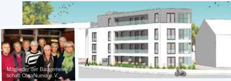
Mitglieder der Baugemeinschaft CasaNueva e.V.